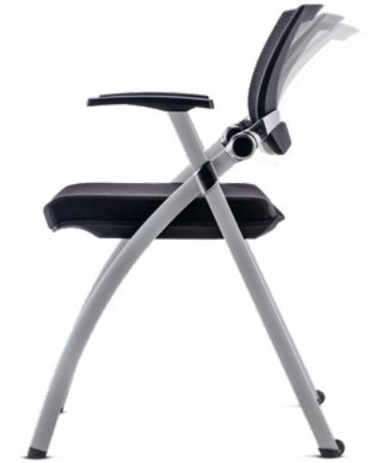
02102LYR5MTPL 2 ruedas traseras