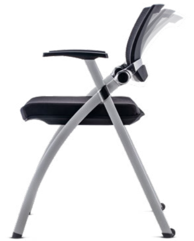
02102LYR5MTPL 2 ruedas traseras