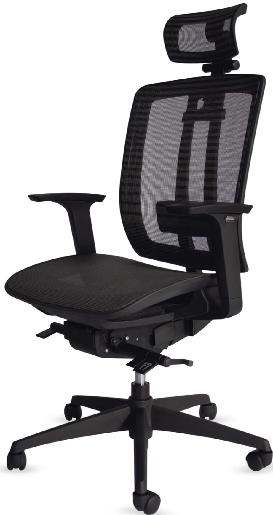
02102LY13XMGN Silla ejecutiva

De 28" de diámetro que proporciona estabilidad de uso, con rodajas nylon de fácil desplazamiento en cualquier tipo de piso.