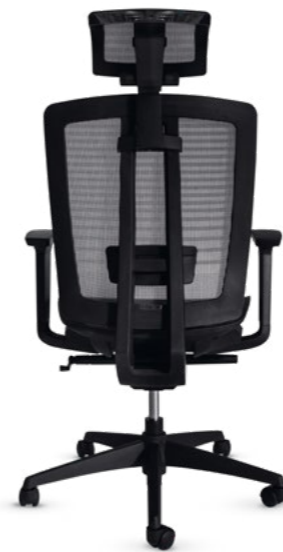
02102LY13XMGN Silla ejecutiva con cabecera