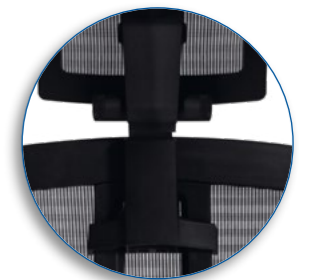
Perillas de ajuste para cabecera