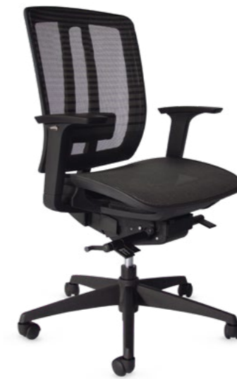
02102LY13AMGN Silla ejecutiva