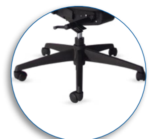
Base giratoria de cinco puntos