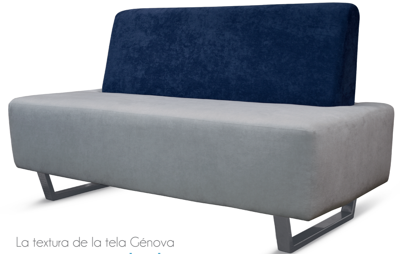
03100PO2PMGFC Sofá dos plazas

La textura de la tela Génova brinda suavidad y su diseño es innovador