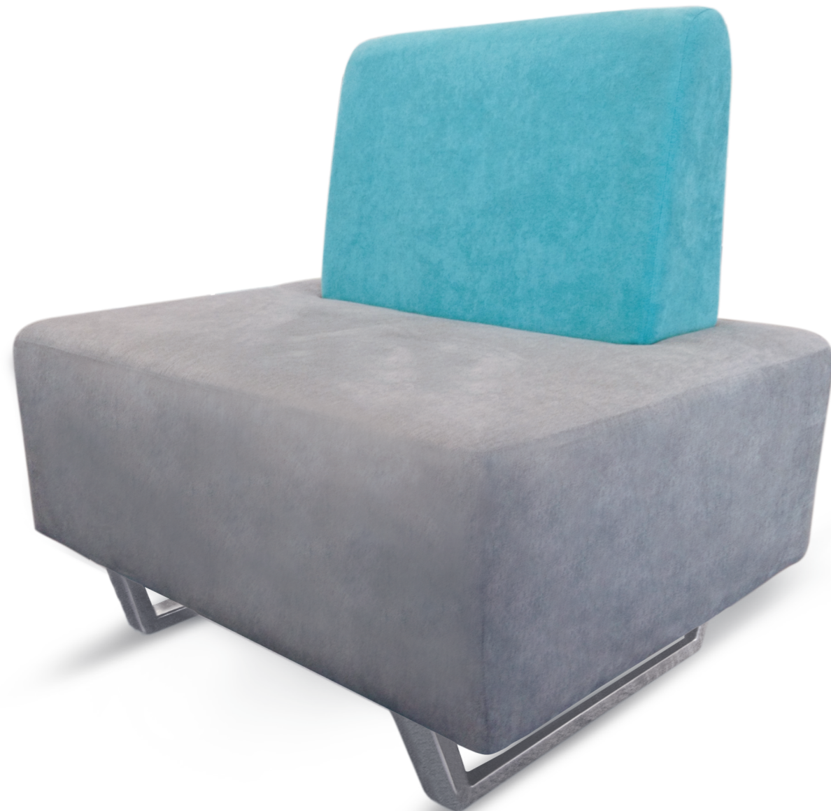
03100PO1PMGFC Sofá una plaza

Tubular en acabado de aluminio o cromo, tiene forma de marco, lo cual estiliza el sillón.